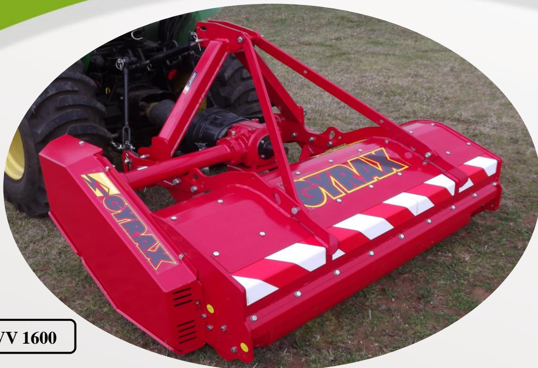
Version BHVV 1600