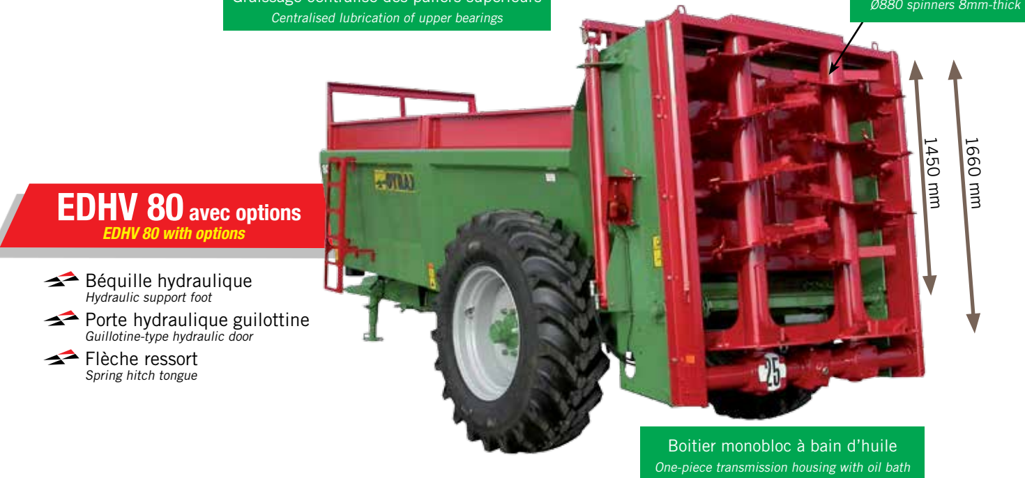
EDHV 80 avec options EDHV 80 with options

Eparpilleurs à grand dégagement, Ø750, EP10, 5 spires High-output spinners, 5-TURN Ø750 spinners 10mm-thick