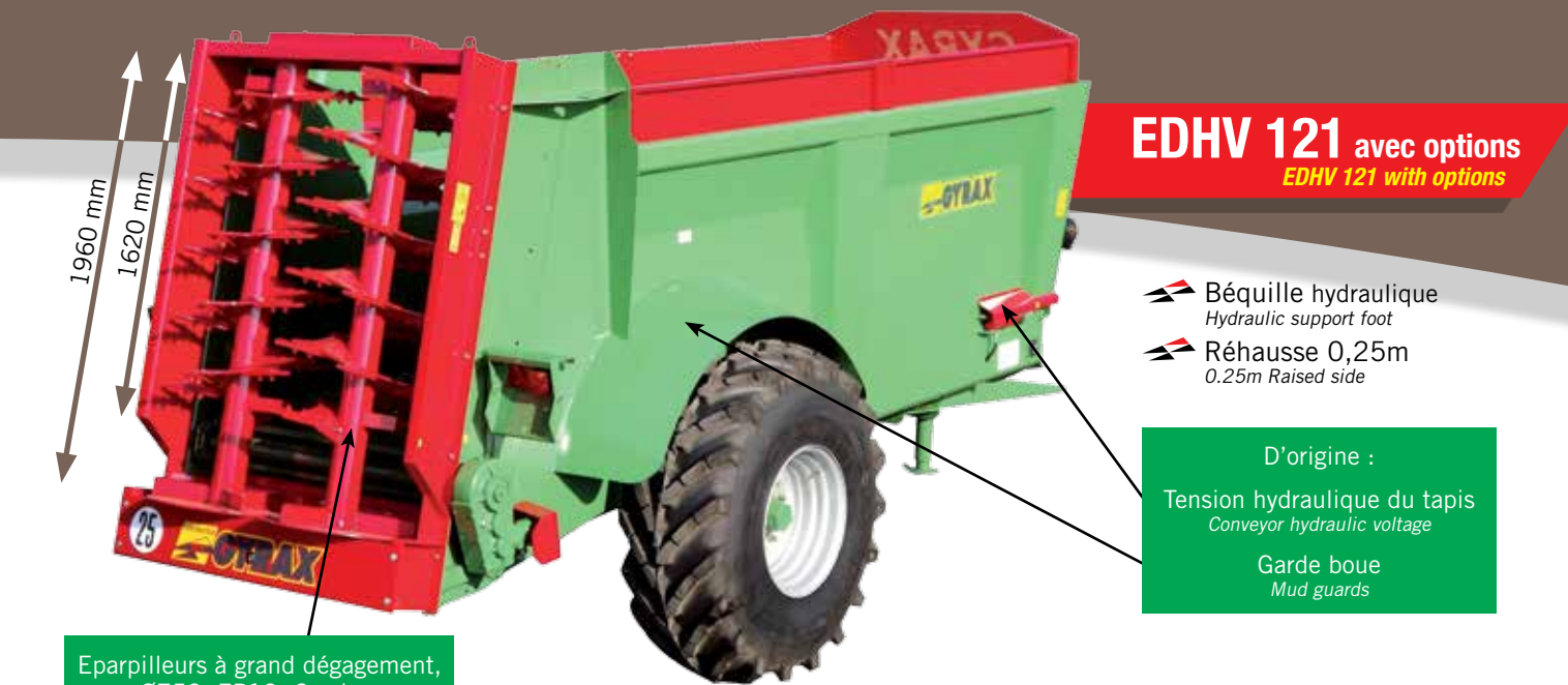
EDHV 121 avec options EDHV 121 with options