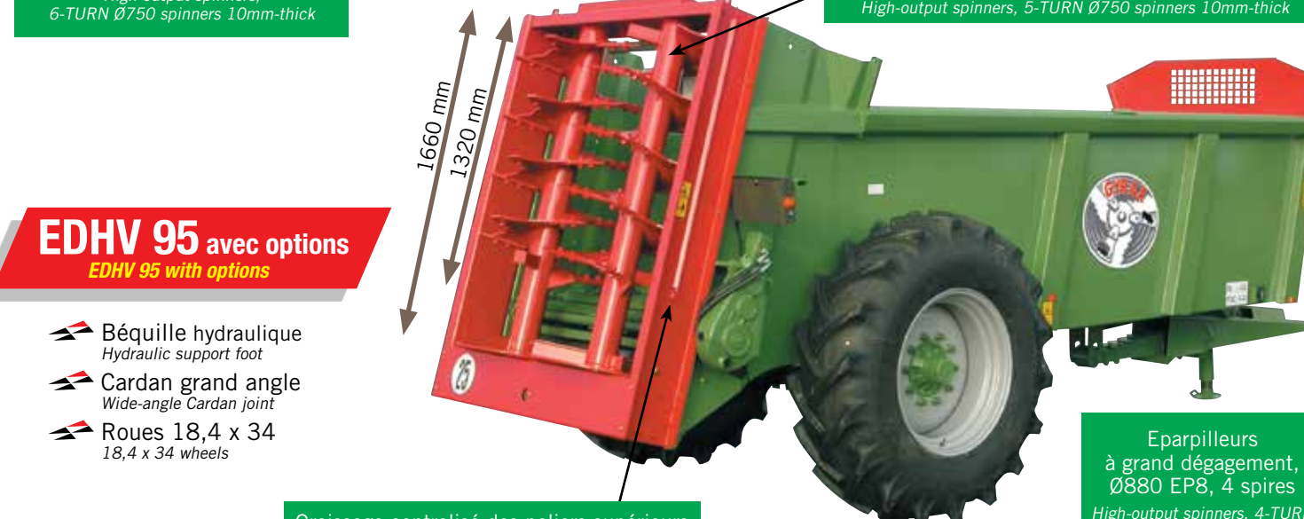
EDHV 95 avec options EDHV 95 with options

Eparpilleurs à grand dégagement, Ø750, EP10, 6 spires High-output spinners, 6-TURN Ø750 spinners 10mm-thick