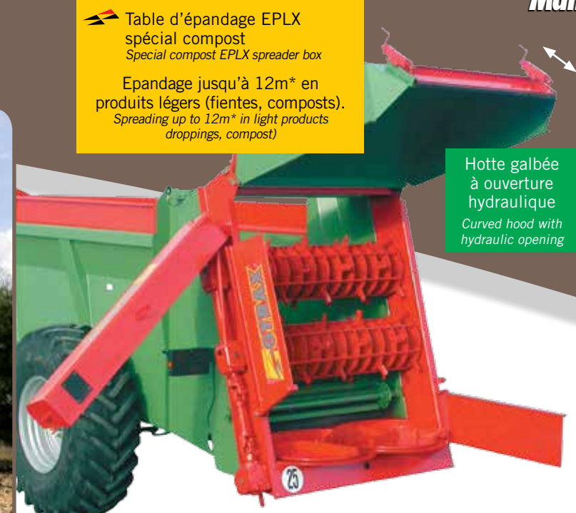
Table d'épandage EPLX spécial compost Special compost EPLX spreader box Epandage jusqu'à 12m* en produits légers (fientes, composts). Spreading up to 12m* in light products droppings, compost)

Hotte galbée à ouverture hydraulique Curved hood with hydraulic opening